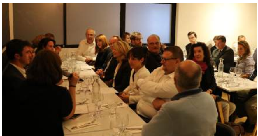
Au dîner-débat à Montrouge sur l'agriculture urbaine