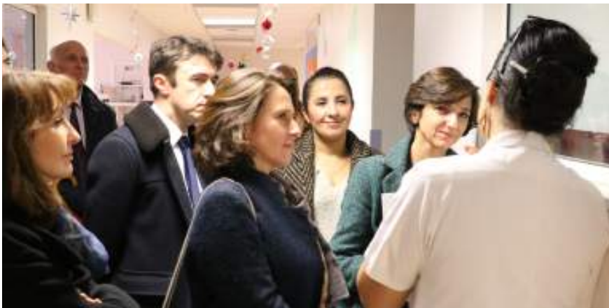
Dans les services de l'Hôpital d'Enfants de Margency

Engagement tenu pour les élus MoDem du conseil régional d'Île-de-France qui ont complété leur cycle de journées de terrain dans les huit départements franciliens.