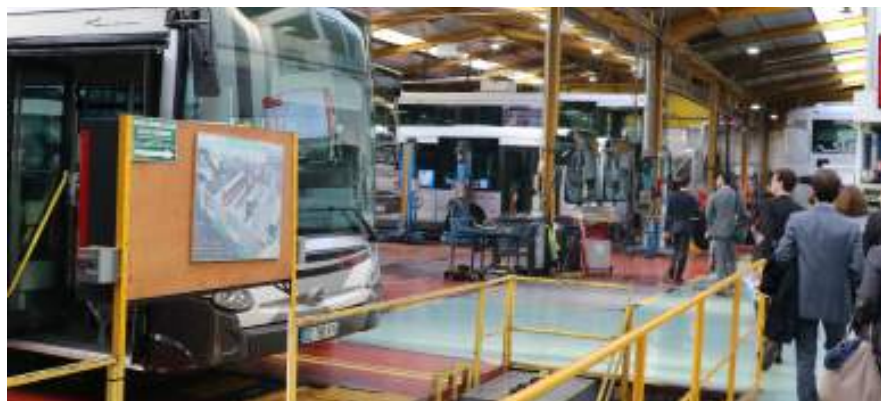
Sur le site de maintenance et de remisage de Transdev