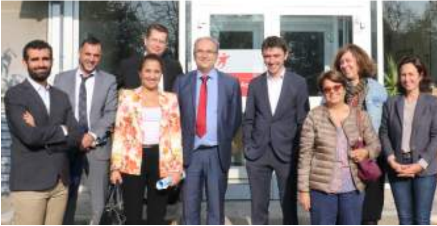
Sur le site Transdev de Villepinte

Pour la septième journée de terrain de l'année, les élus MoDem du conseil régional d'Île-de-France se sont rendus le 18 octobre dernier en Seine-Saint-Denis.