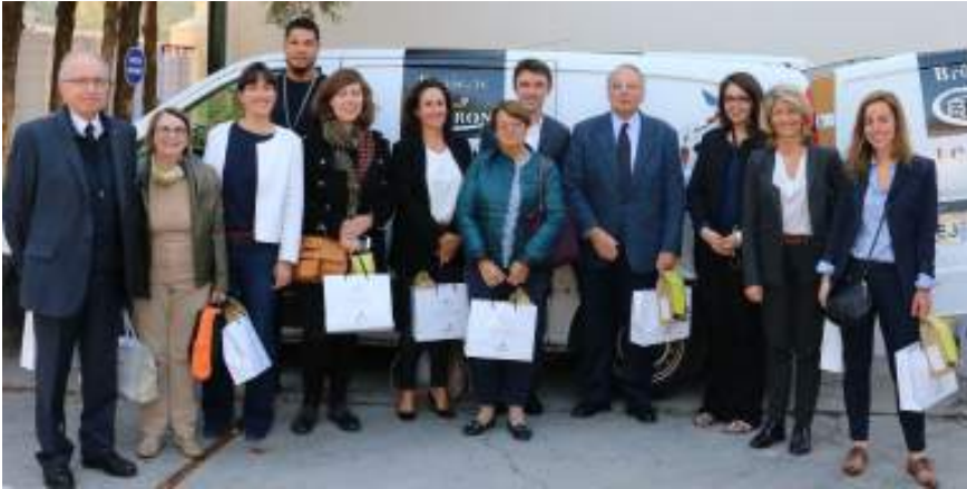
A Chatillon avec le député Jean-Louis Bourlanges

Ces deux derniers mois les élus MoDem ont poursuivi leurs déplacements de terrain pour aller à la rencontre des différents acteurs économiques ou associatifs d'Ile-de-France